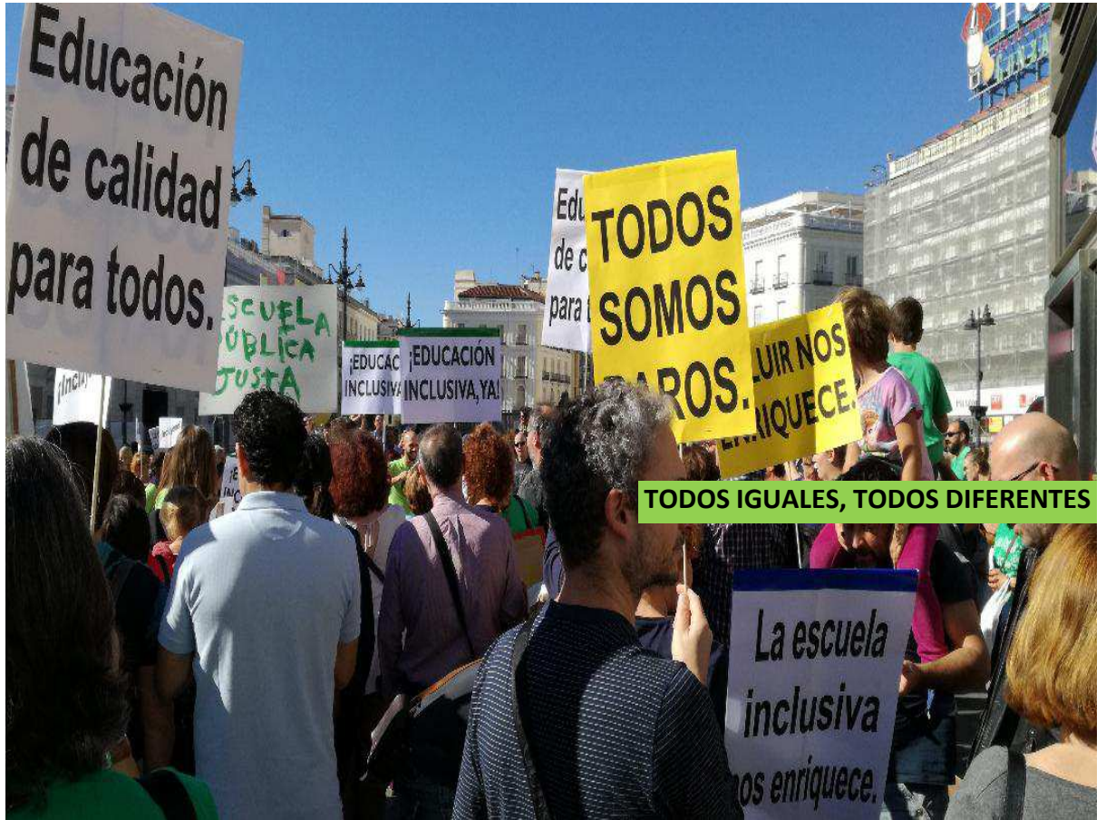
Concentración en la Puerta de El Sol (Madrid), 29 - octubre -2017